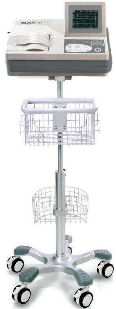
*Soporte pedestal metálico opcional